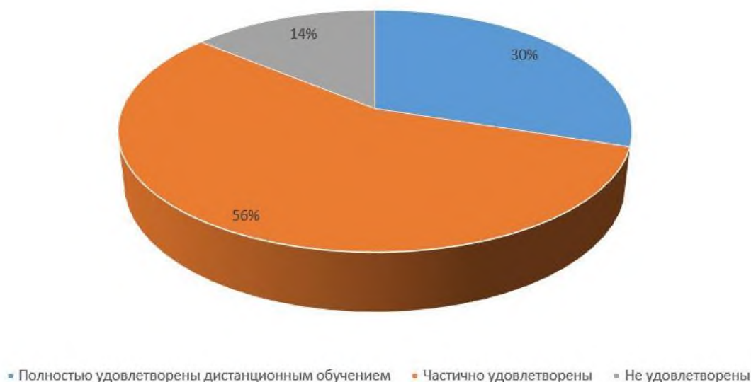
Степень удовлетворенности родителей дистанционным обучением

Школа продолжила проводить в 2022 году мониторинг удовлетворенности родителей и учеников дистанционным обучением посредством опросов и анкетирования.